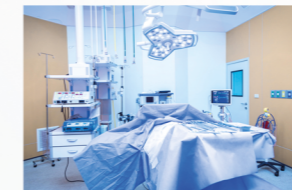
Tıbbi Tekstil Ürünleri Medical Textile Products