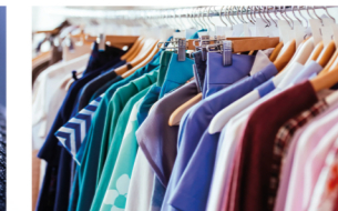
Hazır Giyim Üretimi Ready-to-Wear Production