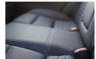
Otomotiv Tekstilleri Automotive Textiles