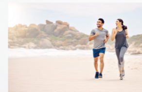
Spor ve Günlük Giyim Sports and Casual Wear

Bağlar Mahallesi, 21. Sokak, No: 7/A Güneşli, Bağcılar, İstanbul, TÜRKİYE (+90) 212 438 12 90 (+90) 542 356 77 65 www.karashinkumascilik.com info@karashinkumas.com.tr